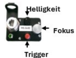
AIT Easy Mesh 2.0 Software